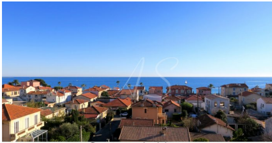
Secteur du bien